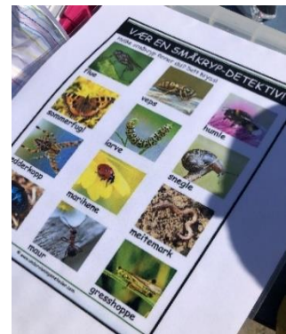
Oppgaveark vi har brukt

Rammeplan for barnehager sier under fagområdet Natur, miljø og teknologi blant annet at: